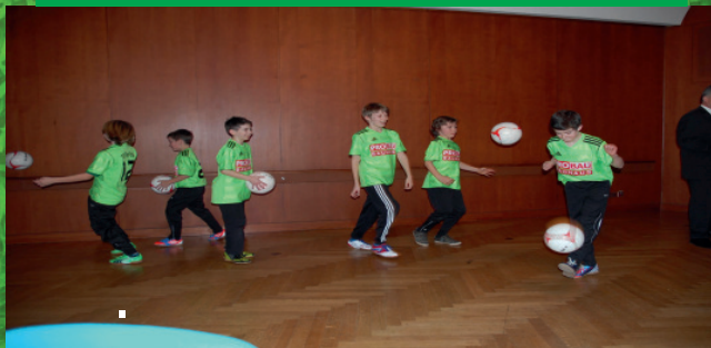
Die Juniorenspieler bei der Ball-Jonglier-Einlage