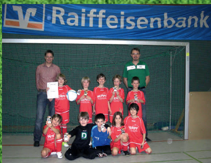
Das siegreiche F1-Team

Die F1- Junioren des TSV Bad Abbach holten sich den Sieg