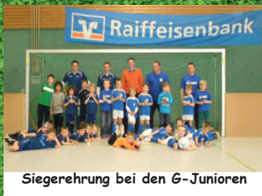
Siegerehrung bei den G-Junoren