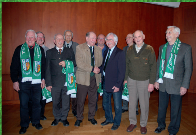
Ehrung der langjährigen Mitglieder