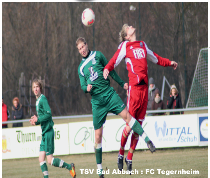
TSV Bad Abbach : FC Tegernheim