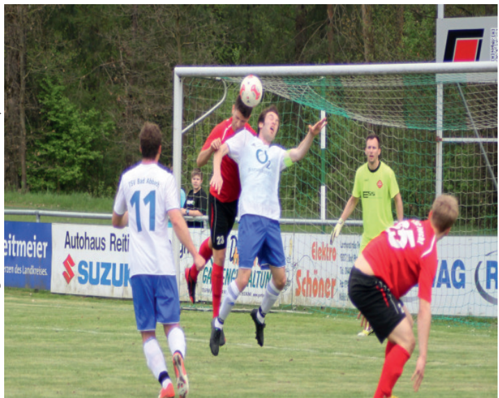
TSV Bad Abbach : TSV Kareth-Lappersdorf