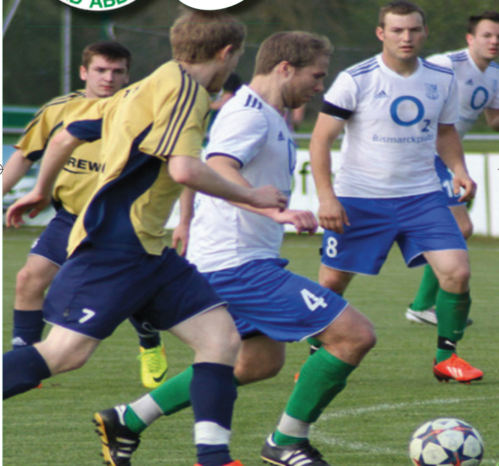
TSV Bad Abbach : SpVgg Deggendorf