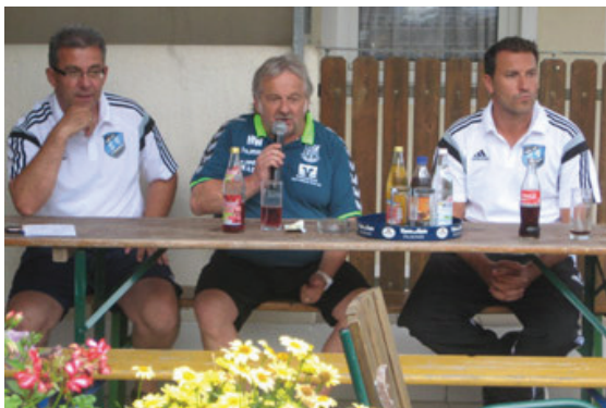
Pressekonferenz nach dem Spiel in Etzenricht